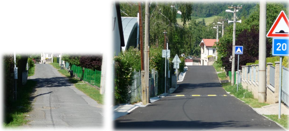
Památník padlým U Zvoničky (2015) – před a po